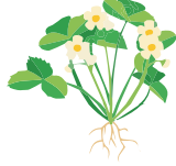
Tomurcuklanmaya başlama evresi