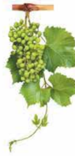
Tanelerin salkıma dönüşmesi