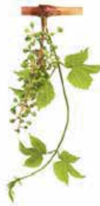
Tane oluşum evresi