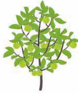
активный рост плодов